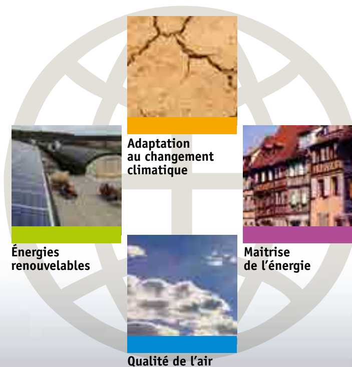
Schéma régional Climat Air Énergie Alsace